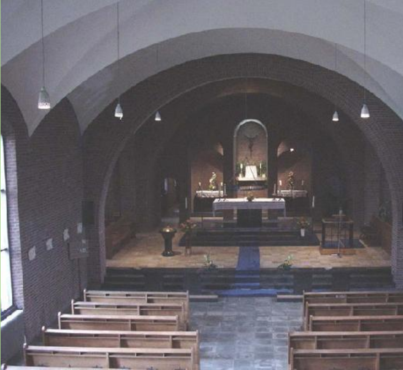
Zicht op het priesterkoor