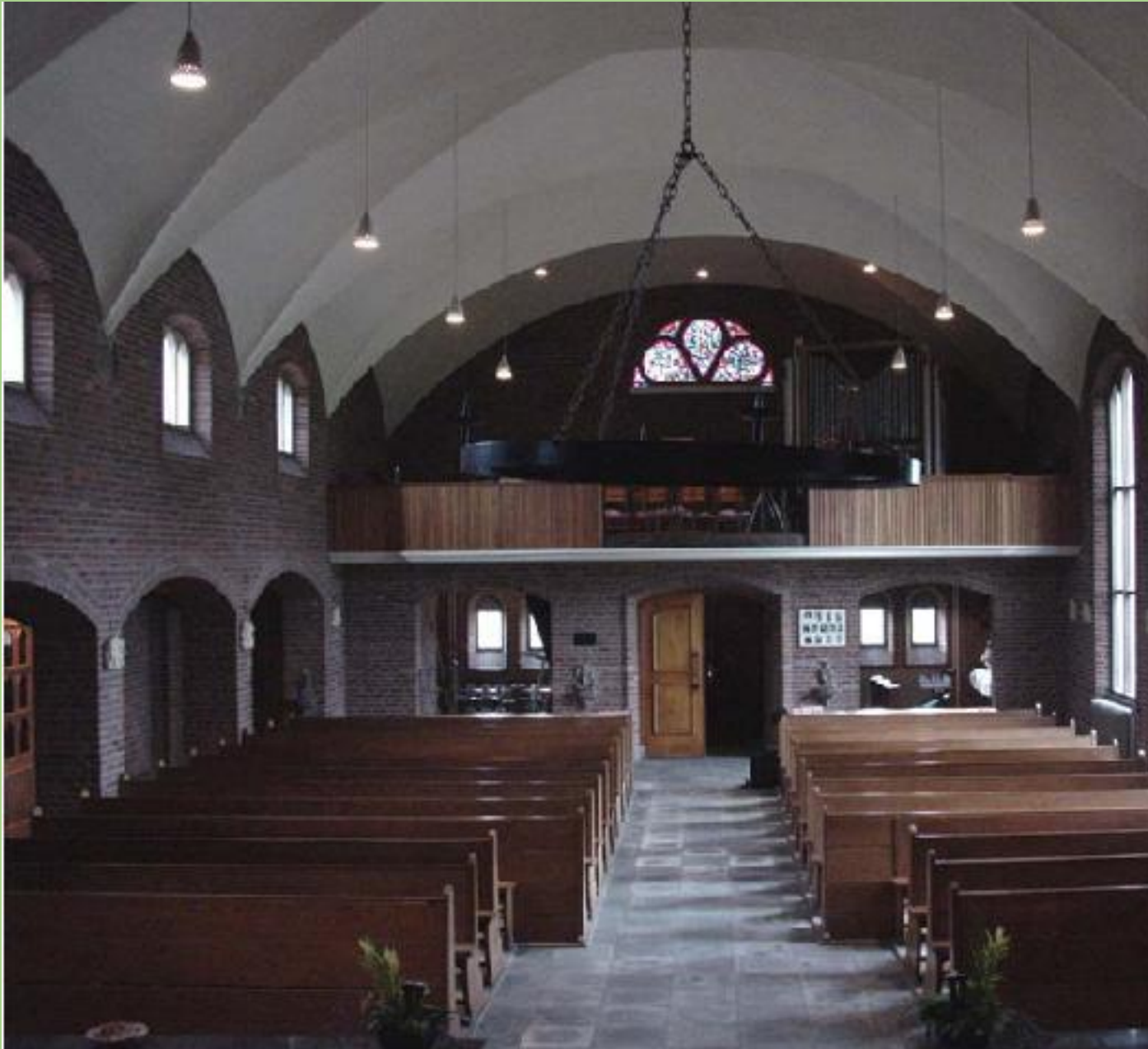
Zicht op de zangtribune

De kerk wordt betreden door een rechthoekig portaal. Dit is van de kerk afgescheiden door een dubbele houten tochtdeur. Daarnaast staan aan weerszijden twee kapellen. De kapellen bestaan uit een rechthoekige ruimte met twee rechte vensters in een rondboog nis. De voormalige doopkapel heeft een verlaagde vloer. De Mariakapel heeft een in keperverband opgemetseld altaar. De kapellen zijn van het schip afgescheiden door een segmentboog. In de voormalige doopkapel bevindt zich hieronder een ijzeren hekwerk. Het schip heeft bepleisterde kruisgewelven en heeft muren met bakstenen in wild verband. De vloer is belegd Grunendal kwartsiet. Het schip heeft aan de linkerzijde drie rondboogvensters. Aan de rechterzijde staat een processiegang, afgescheiden door scheibogen. Licht treedt in de lichtbeuk binnen door rondboogvensters. Boven de ingang staat de zangtribune, met een houten balustrade. Licht wordt hier verkregen door een getraceerd roosvenster. De zijbeuk heeft rechte vensters in een