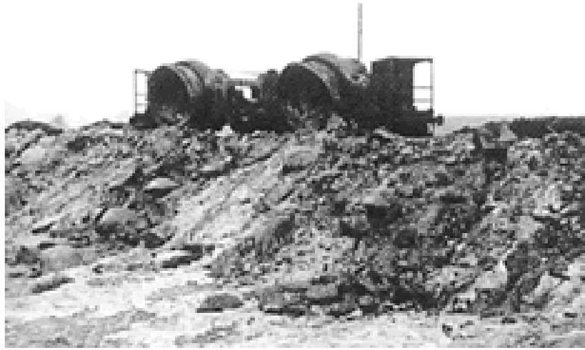
Op de 'slakkenberg' in Salzgitter moest in de bittere kou boven de gloeiend hete afvalresten van de staalfabrieken gewerkt worden.

Misschien woonde je (over)grootvader of (over)grootmoeder in 1944 in een ander dorp dan jij nu. Die kun je natuurlijk ook gaan ondervragen. De informatie die je opschrijft, wordt op de website gezet bij het dorp waar je (over)grootvader is opgepakt.